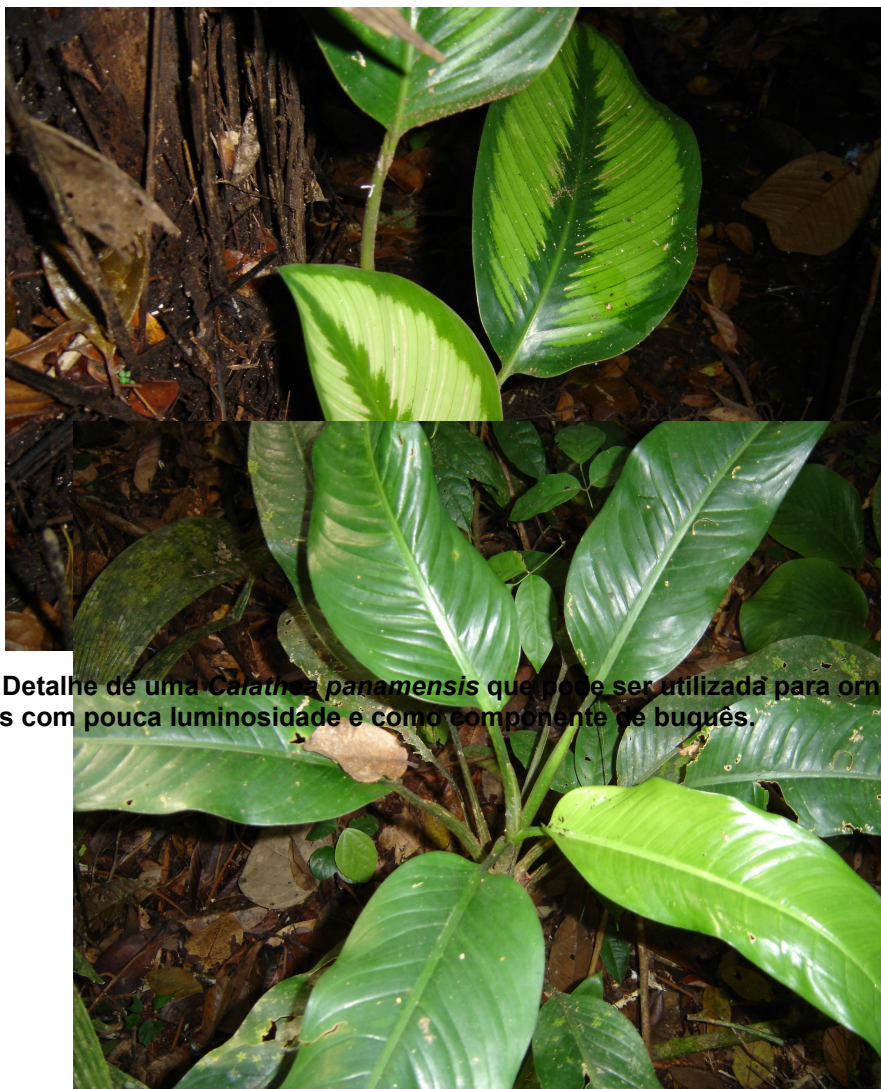
Figura 3: Detalhe de uma Calathea panamensis que pode ser utilizada para ornamentação de ambientes com pouca luminosidade e como componente de buquês.

Na floresta próxima ao rio Pardo, onde foi amostrada uma área de 4.000 m 2 , identificou-se 255 indivíduos, distribuídos em 5 famílias e 6 espécies, onde sobressaiu-se a família Marantaceae (Tabela 1). No âmbito dessa família a espécie Calathea panamensis (Figura 3) contribuiu com 165 indivíduos e a Monotagma sp com, somente, 2 indivíduos. Em segundo lugar, em ocorrência, aparecem as famílias das Araceae e Heliconiaceae, ambas com uma espécie. As espécies Dieffenbachia sp (Figura 4) e Heliconia sp (Figura 5) apresentaram 38 indivíduos, cada uma. Discretamente, as famílias Costaceae e Strelitziaceae foram representadas, respectivamente, pelas Costus congestiflorus (com 7 indivíduos) e Phenakospermum guianensis (com 5 indivíduos).