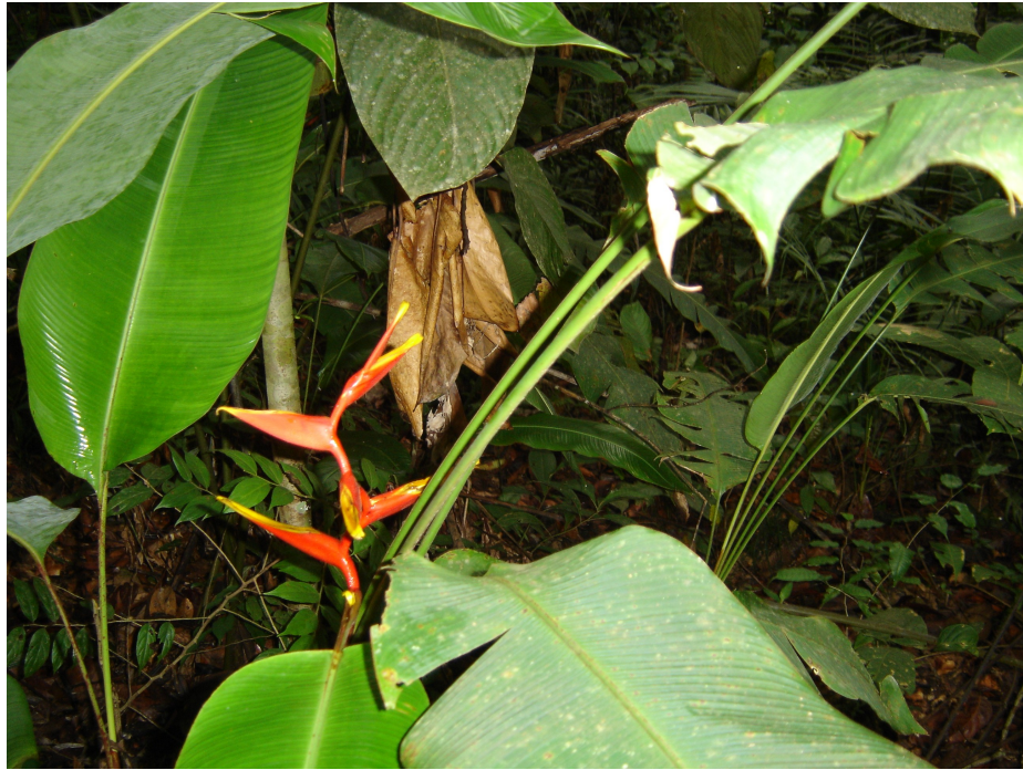
Figura 6: Detalhe de Heliconia spathocircinata identificada em floresta secundária do ramal Canoas, em Presidente Figueiredo AM.

No âmbito da família Heliconiaceae, a espécie Heliconia spathocircinata (Figura 6) foi a que apresentou o maior número de indivíduos (80), a Heliconia acuminata (figura 7) apresentou 62 indivíduos e a Heliconia chartacea 57 indivíduos. Quantitativamente, a família Marantaceae vem em segundo lugar com 20 indivíduos, representados pelas espécies Ischnosiphon obliquus (15 indivíduos) e a Calathea fragilis com 5 indivíduos. Na sequência seguem as famílias Arecaceae (19 indivíduos) representadas pelas espécies Syagrus inajai (12 indivíduos), Socratea sp (4 indivíduos) e a Geonoma maxima com 3 indivíduos. A família Strelitziaceae foi representada por uma única espécie, a Pernakospermum guyanense com 10 indivíduos. A família Costaceae apresentou 3