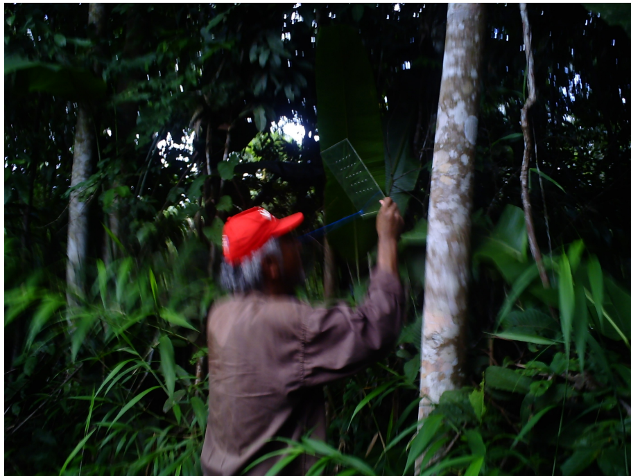
Figura 2. Área de floresta secundária, mostrando uma prática de medição da abertura de dossel com uso do instrumento Canopy-scope.

A abertura do dossel foi avaliada através da medição do raleamento do dossel em todas as partes do transecto, fazendo quatro visadas, com o Canopy-scope (Figura 2), de acordo com os pontos cardeais e estimada a média em percentual. O “Canopy-Scope” é um instrumento simples, confeccionado com uma chapa de acrílico de 25x25cm, contendo orifícios de 1 mm de diâmetro, distribuídos na chapa de 3 em 3 cm (Brown, 2000). Os valores encontrados sobre a incidência de luminosidade (Anexo I, II e III) foram analisados por meio do método de análise de correspondência multivariada, de maneira semelhante a adotada na avaliação do potencial ornamental das plantas identificadas.